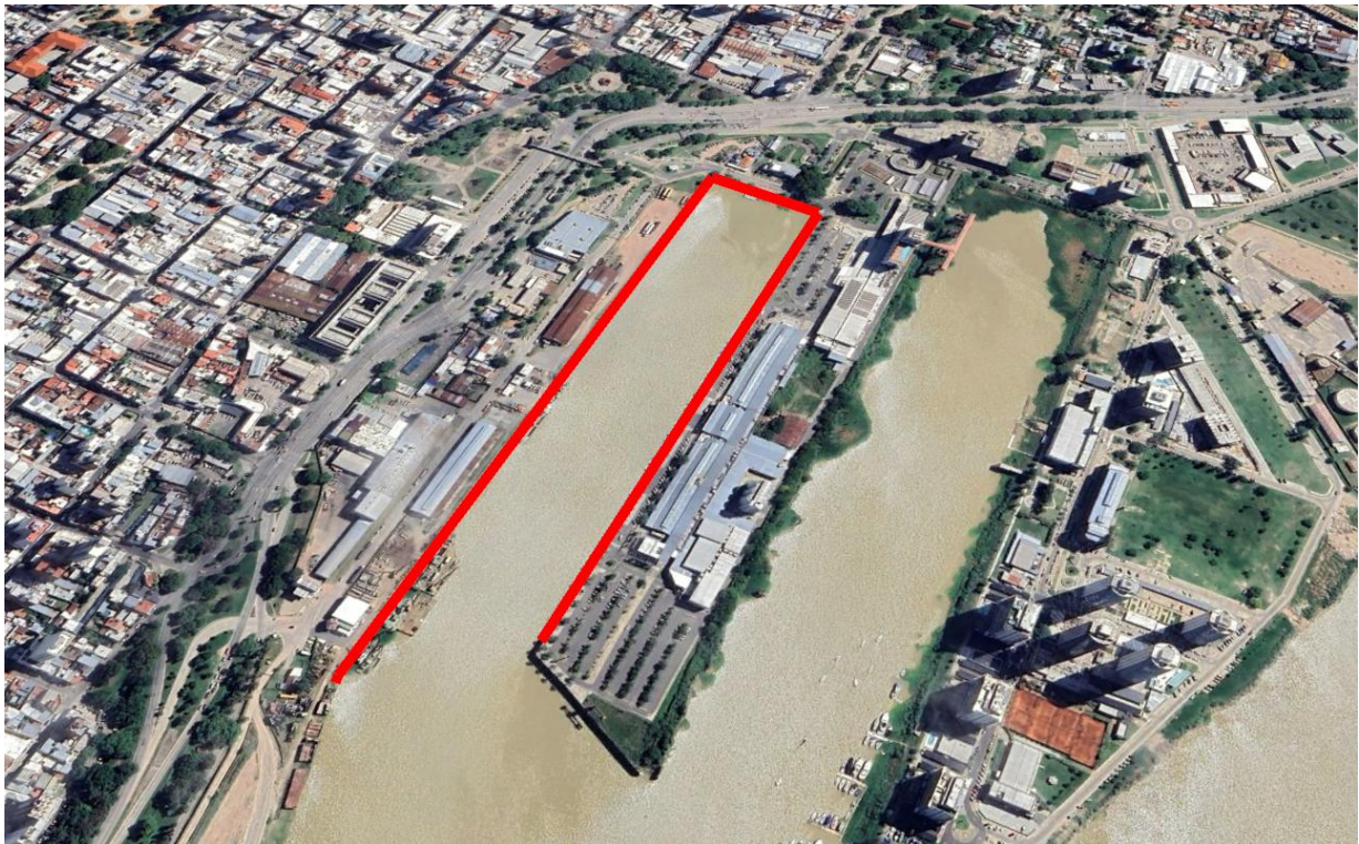
Sector de 1300 metros de muelle a relevar con inspecciones subacuáticas en la dársena 1.